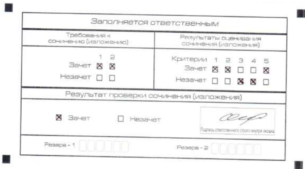
Рис. 1. Область для оценки работы

После окончания заполнения бланка регистрации ответственное лицо ставит свою подпись в специально отведенном для этого поле.