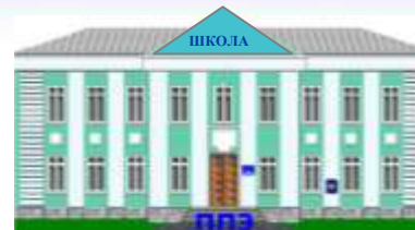
График выезда сотрудников московского центра качества образования в ОО размещен на сайте rsoi.msko.ru в разделе ГИА-9 и ГИА-11 → Информация для организаторов