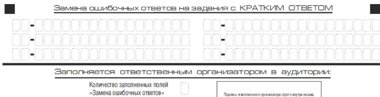
Рис. 9. Область замены ошибочных ответов на задания с кратким ответом

Запрещается записывать ответ в виде математического выражения или формулы. В ответе не указываются названия единиц измерения (градусы, проценты, метры, тонны и т.д.) – так как они не будут учитываться при оценивании. Недопустимы заголовки или комментарии к ответу.