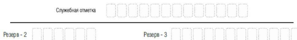
Рис. 5 Поля для служебного использования

Поля для служебного использования «Служебная отметка», «Резерв-2» и «Резерв-3» не заполняются.