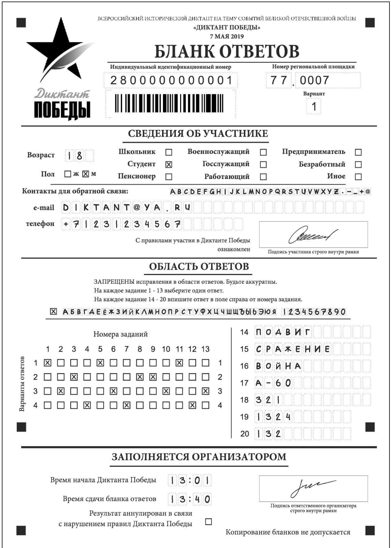
Рис. 1. Бланк ответов