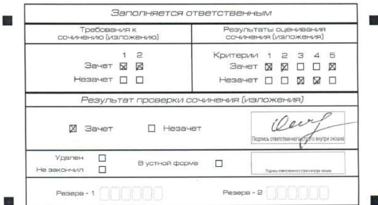
Рис. 2. Область для оценки работы

После окончания заполнения бланка регистрации ответственное лицо ставит свою подпись в специально отведенном для этого поле.