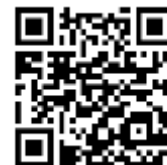
Образцы бланков ГИА-9